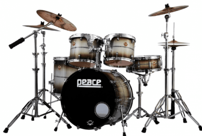
Immagine indicativa: disponibile solo con tom sospesi

“Un drumset professionale ad un prezzo conveniente!”. E' questo il giudizio di DNA secondo l'illustre testata di settore statunitense “DRUM!”. Le caratteristiche di questa serie risultano infatti strepitose: partendo dai fusti 9 strati in Acero Nord-Americano fino ad arrivare alle meccaniche Duotone® includendo nei set un hardware di tutto rispetto tra cui il pedale grancassa a doppia catena P-870 fino all'Hi-Hat stand A-Frame HS-810A. Tutti i fusti sono dotati del sistema di fissaggio nativo Arial-Lock™ con braccetti DA-147. A completare l'unicità di DNA Chrome vi sono le finiture speciali laccate, una varietà di colori e motivi impensabili fino ad ora in una fascia di prezzo simile come ad esempio la nuova finitura HIEROGLYPHICS o gli ormai famosi Sparkle Peace®.