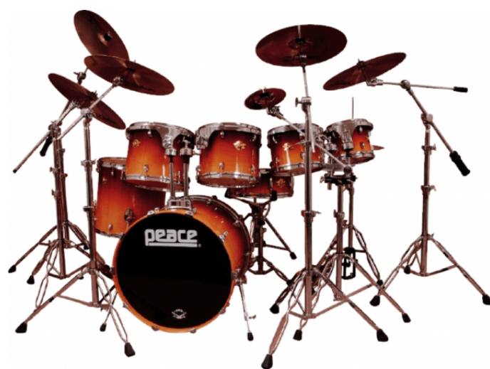
Immagine indicativa: Disponibile solo con tom sospesi

“Un drumset professionale ad un prezzo conveniente!”. E' questo il giudizio di DNA secondo l'illustre testata di settore statunitense “DRUM!”. Le caratteristiche di questa serie risultano infatti strepitose: partendo dai fusti 9 strati in Acero Nord-Americano fino ad arrivare alle meccaniche Duotone® includendo nei set un hardware di tutto rispetto tra cui il pedale grancassa a doppia catena P-870 fino all'Hi-Hat stand A-Frame HS-810A. Tutti i fusti sono dotati del sistema di fissaggio nativo Arial-Lock™ con braccetti DA-147. A completare l'unicità di DNA Chrome vi sono le finiture speciali laccate, una varietà di colori e motivi impensabili fino ad ora in una fascia di prezzo simile come ad esempio la nuova finitura HIEROGLYPHICS o gli ormai famosi Sparkle Peace®.